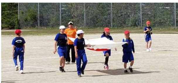
＜国旗をもって行進！＞

代表委員会の話し合いで、今年度の運動会のテーマが決まりました。令和元年にふさわしい、かっこいいテーマになりましたね！