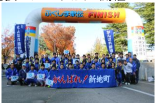
(ふくしま駅伝大会)

会員23名、老若男女、年間を通して練習会や交流会、マラソン大会の開催など楽しく活動しています。仲間と一緒にランニングを楽しみたいという方、経験の有無は問いません!一緒に活動しましょう!