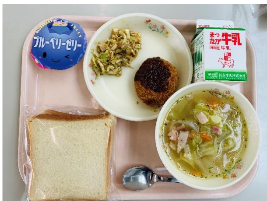
「黒毛和牛メンチカツサンドでいただきました!」

給食食材について、国の無償提供事業が続いています。なかなか給食では食べることのできない「真鯛」や「黒毛和牛」など、給食でおいしくいただいています。おいしい食材から、心と体に元気をいただいていることに、感謝していきたいと思えます。